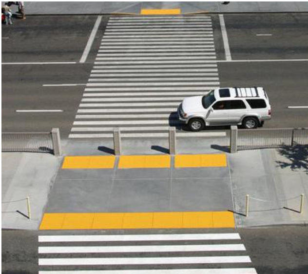
Indicateurs tactiles de surface de marche à dômes tronqués